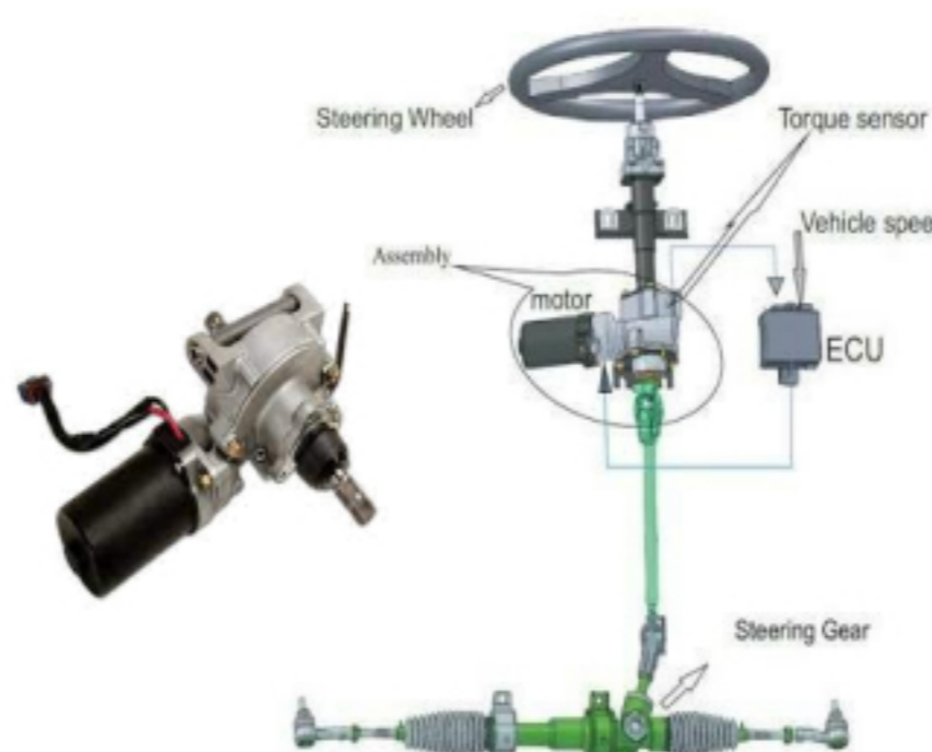
电子助力转向系统